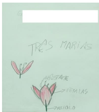
Figura 3: Representação da flor da espécie três-marias em uma turma do 5º ano.

As exsicatas foram produzidas com as principais espécies que se encontram no local: Calliandra tweediei , Stiffia chrysantha , Hibiscus rosa-sinensi , Tillandsia aeranthos , Rhododendron simsii , entre outras. A estratégia foi relevante como instigadora do interesse dos estudantes pela botânica, tal como relatado na entrevista pelo aluno GK: