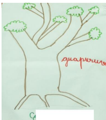
Figura 2: Representação de uma árvore da espécie Guapuruvu em uma turma do 2º ano